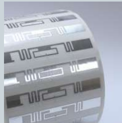
UHF RFID 标签